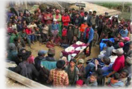
Westnepal & Reintegration

Govinda Entwicklungshilfe e.V - 1. Mitgliederversammlung 2011