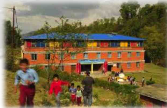
Schule & Ausbildung