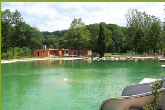
Naturerlebnisbad und Landgasthof Falken