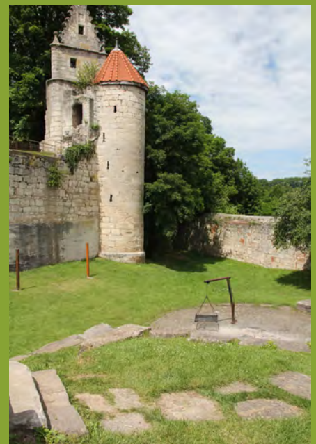
Grillplatz im Burggraben